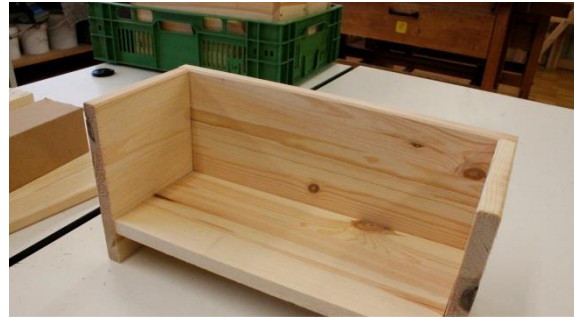
B: Boden einfügen