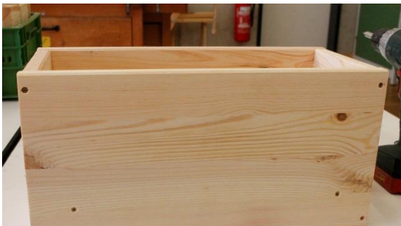
C: Kiste schließen

4. Das Holz der Kräuterkiste außen abschleifen